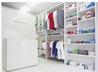
La boutique Comme des Garçons Pocket